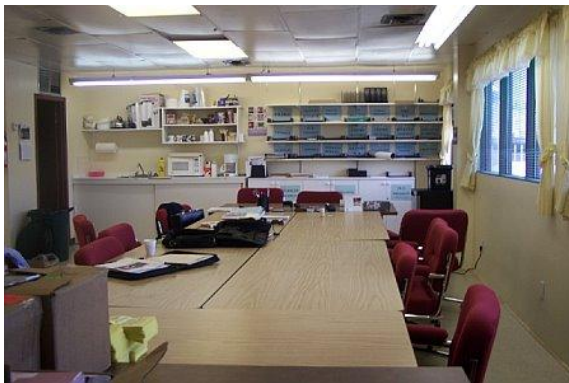
La salle de conférence