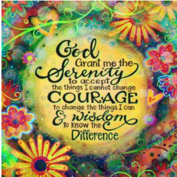
Prière de la Sérénité en Anglais.

J'ai encore pris le temps de compléter mon formulaire d'évaluation et même si je ne pensais qu'à aller me coucher, car j'avais encore une migraine.