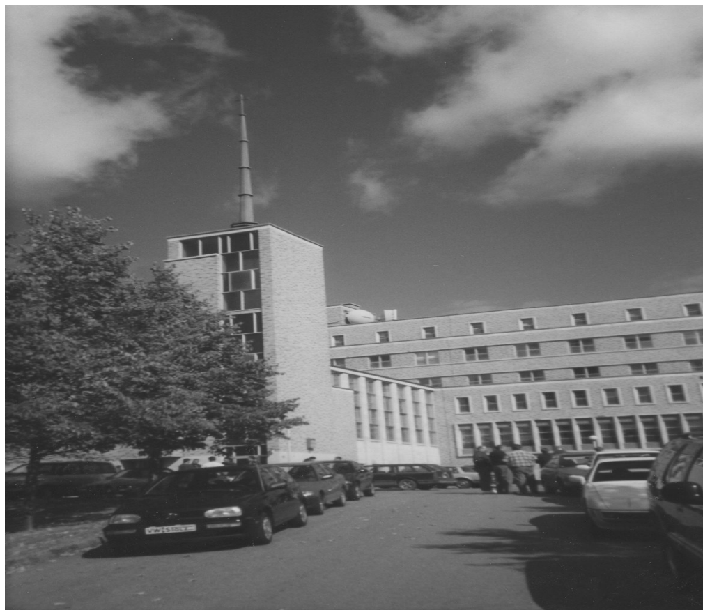
Maison des Jésuites à Lafontaine